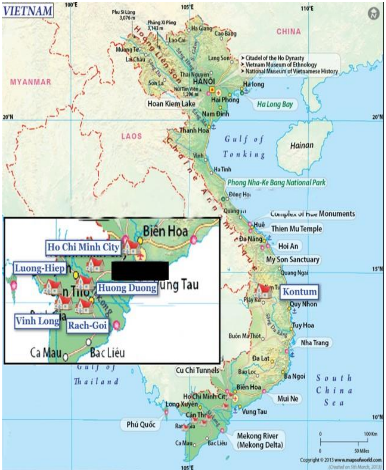
Les structures partenaires et les lieux de vie aidés au Vietnam