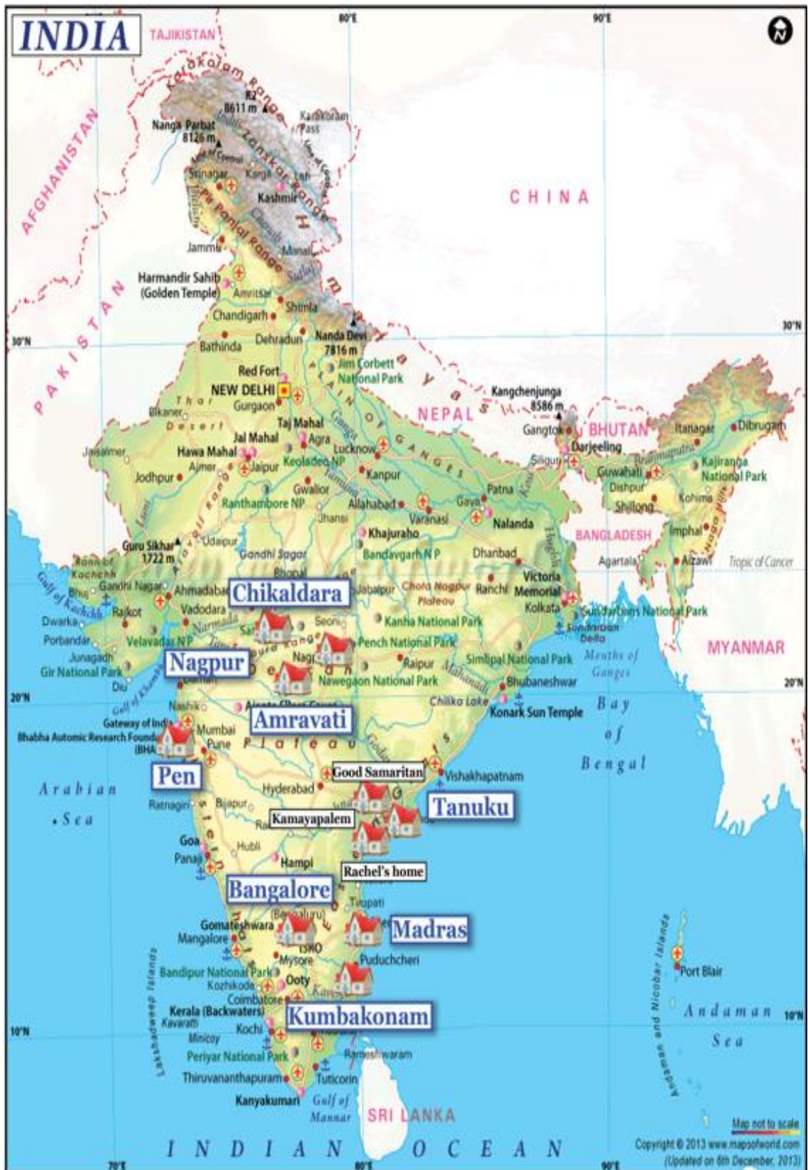
Les structures partenaires et les lieux de vie aidés en Inde