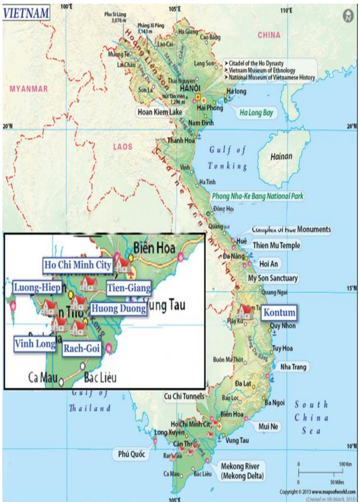
Les structures partenaires et les lieux de vie aidés au Vietnam